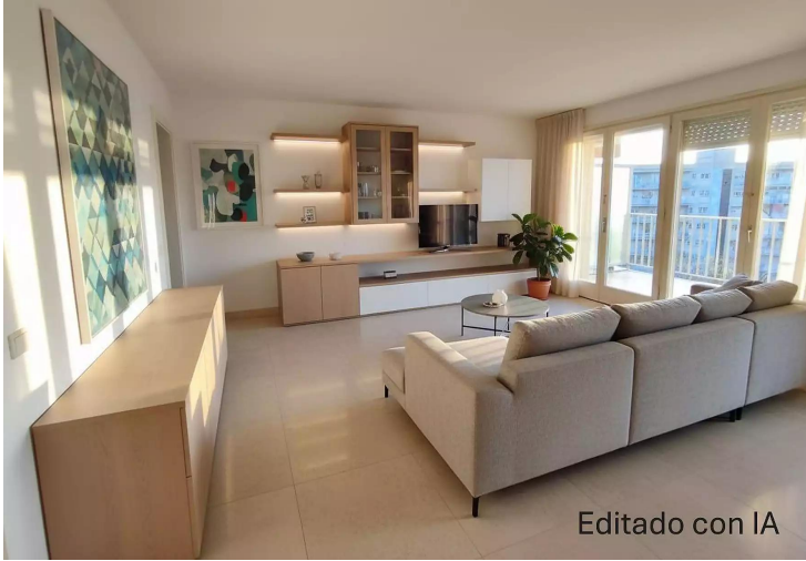
Editado con IA